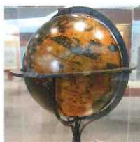
現存する最古の地球儀 ヘイムの地球儀のレプリカ