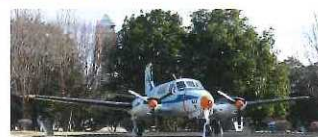
測量用航空機「くにかぜ」