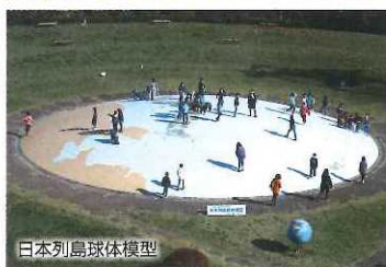
日本列島地球儀模型