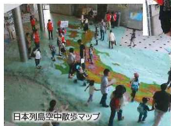
日本列島空中散歩マップ