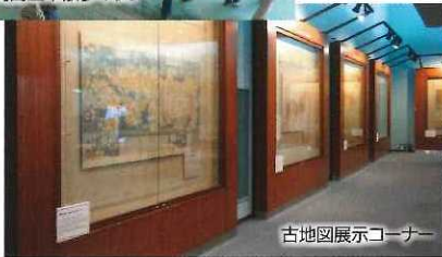
古地図展示コーナー

「地図と測量の科学館」は、地図や測量の歴史やしくみ、機器や地図などを展示する施設です。体験や遊びを通じて地図や測量について楽しく学ぶことができます。