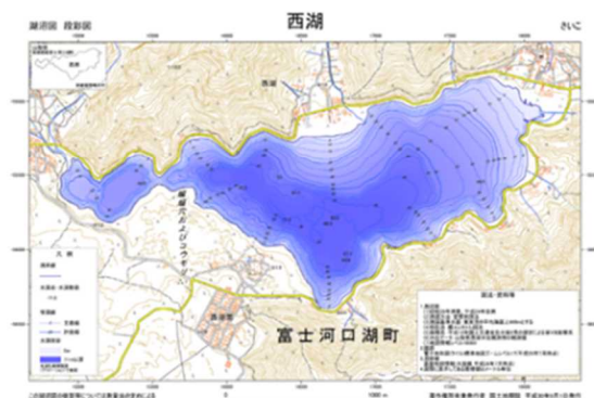
③湖沼図 段彩図（多色）