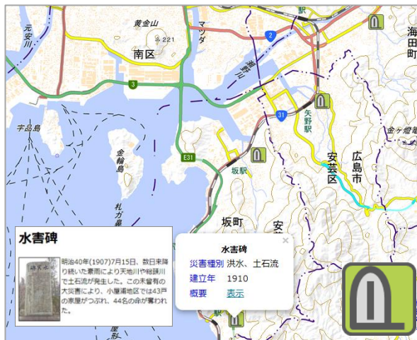
地理院地図における表示イメージ