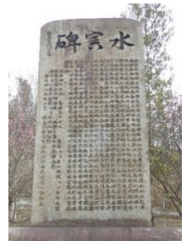
自然災害伝承碑 (広島県坂町小屋浦地区)