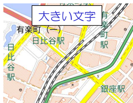
文字が大きい地図