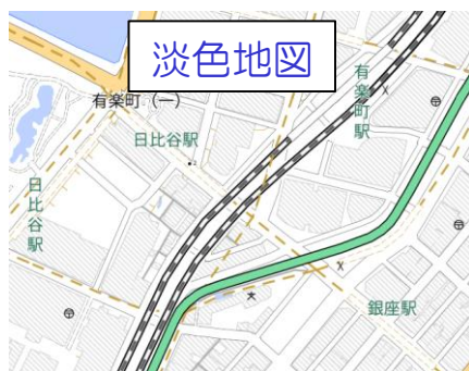
背景図として利用しやすい地図