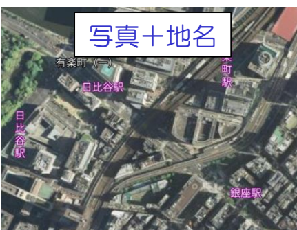
空中写真に地名等を表示