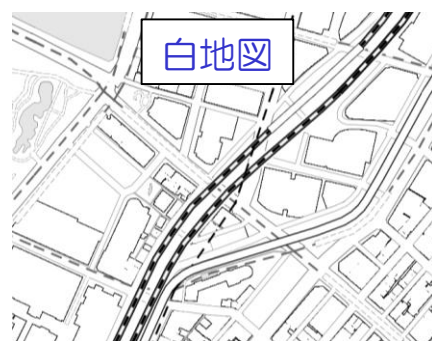
学校の授業に活用可能