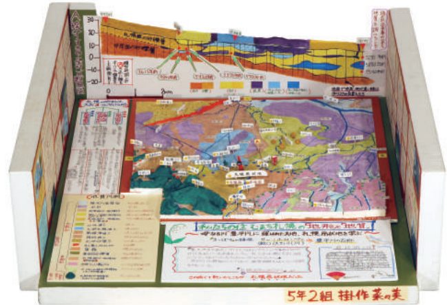
第22回 文部科学大臣賞