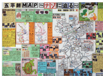
第22回 審査員特別賞