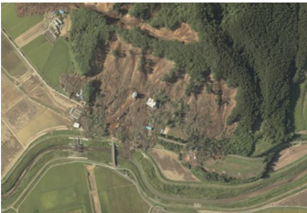
図-2 厚真地区空中写真(山腹崩壊部)

厚真地区では、9月6日、14時55分に青森空港を離陸し、航路途中にある前線を迂回し全コースを撮影できたが、撮影時間が夕刻のため露光不足の画像となった。また機体が雲に突入した際の一部が画像生成不能により、9月8日に再撮影を行った。6日に撮影した写真と合せて撮影地区全域の被災状況を撮影できたため、8日の撮影をもって全撮影を終了した(図-2)。