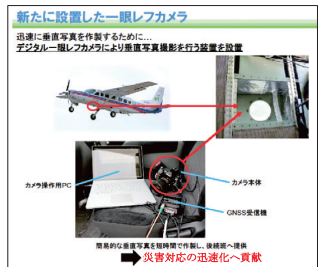
図-3 新たに設置した撮影装置

「くにかぜⅢ」の緊急撮影において、デジタル航空カメラによる撮影と同時並行で機体の直下方向に取り付けた一眼レフカメラ(図-3)による撮影を試験的に行った。直下一眼レフカメラによる撮影データは、同じ高度で撮影した場合、地理院地図でのズームレベル18と同等の解像度(50cm程度)となるものの航空カメラと異なり画像処理が不要となる。これにより、これまで時間を要していた簡易正射画像の提供スピードが格段に早くなることが実証された。