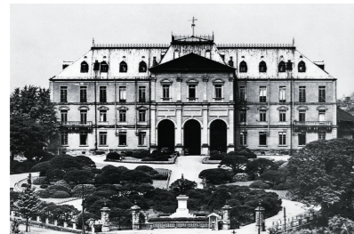
陸地測量部(東京市麹町区)

1888 参謀本部測量局が陸軍参謀本部陸地測量部を経て、翌年に参謀本部陸地測量部となる(明治21年)