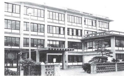
地理調査所(東京都目黒区)