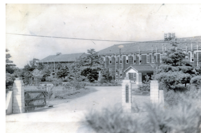
地理調査所(千葉県千葉市)