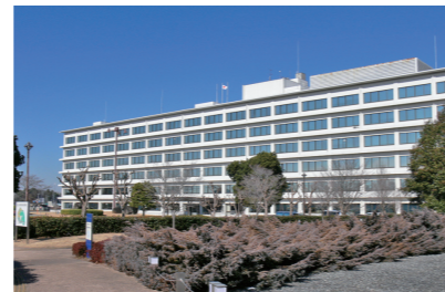
国土地理院本院(茨城県つくば市)